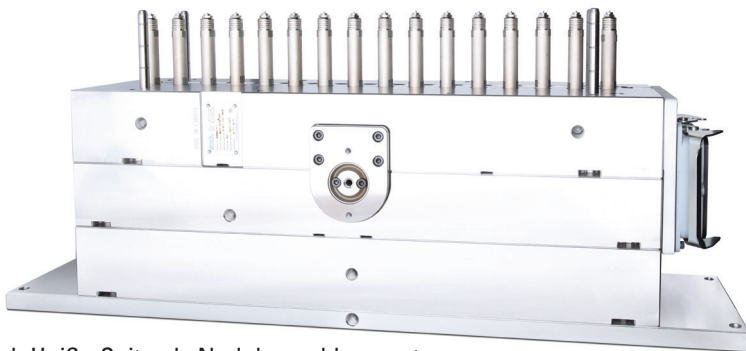
16-fach Heiße Seite als Nadelverschlussystem.