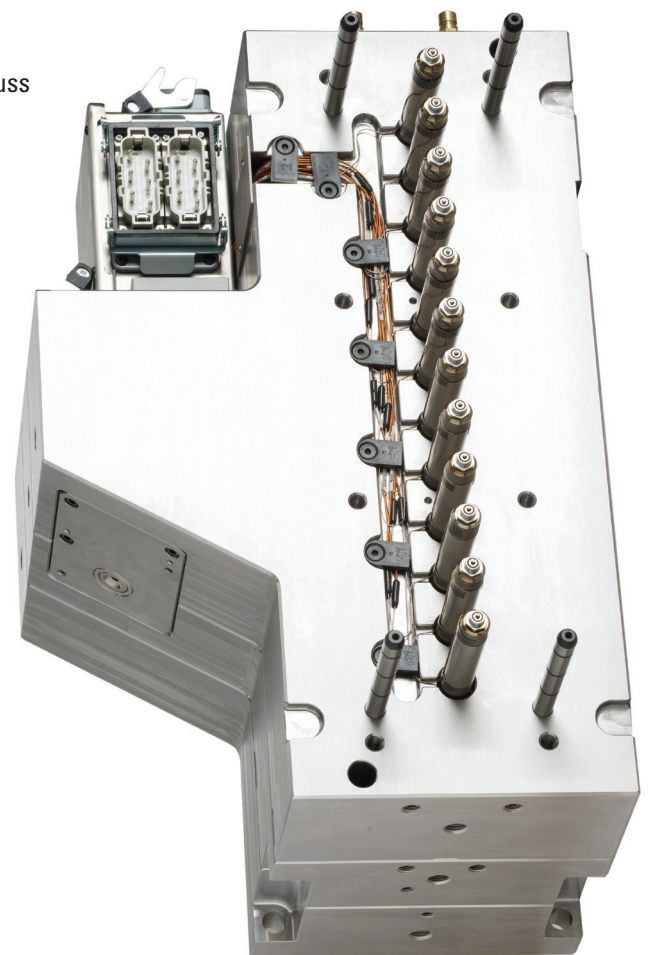
12-fach Heiße Seite als Nadelverschlusssystem.